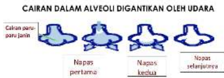
Gambar 2.1 Cairan Alveoli Digantikan oleh Udara

Pernapasan pertama pada bayi baru lahir normal terjadi dalam waktu 30 detik pertama sesudah lahir. Usaha pertama kali untuk mempertahankan tekanan alveoli , selain adanya surfaktan yang dengan menarik napas dan mengeluarkan napas dengan merintih sehingga udara tertahan di dalam. Respirasi pada neonatus biasanya pernapasan diafragmatik dan abdominal , sedangkan frekuensi dalam tarikan belum teratur. Apabila surfaktan berkurang maka alveoli akan kolaps dan paru-paru kaku sehingga terjadi atelektasis , dalam keadaan anoksia neonatus masih dapat mempertahankan hidupnya karena adanya kelanjutan metabolisme anaerobik (Indrayani & Moudy, 2016).